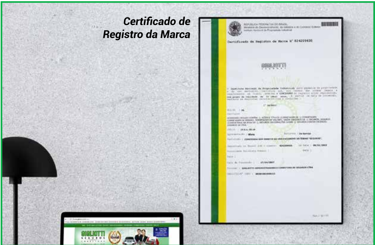
Certificado de Registro da Marca