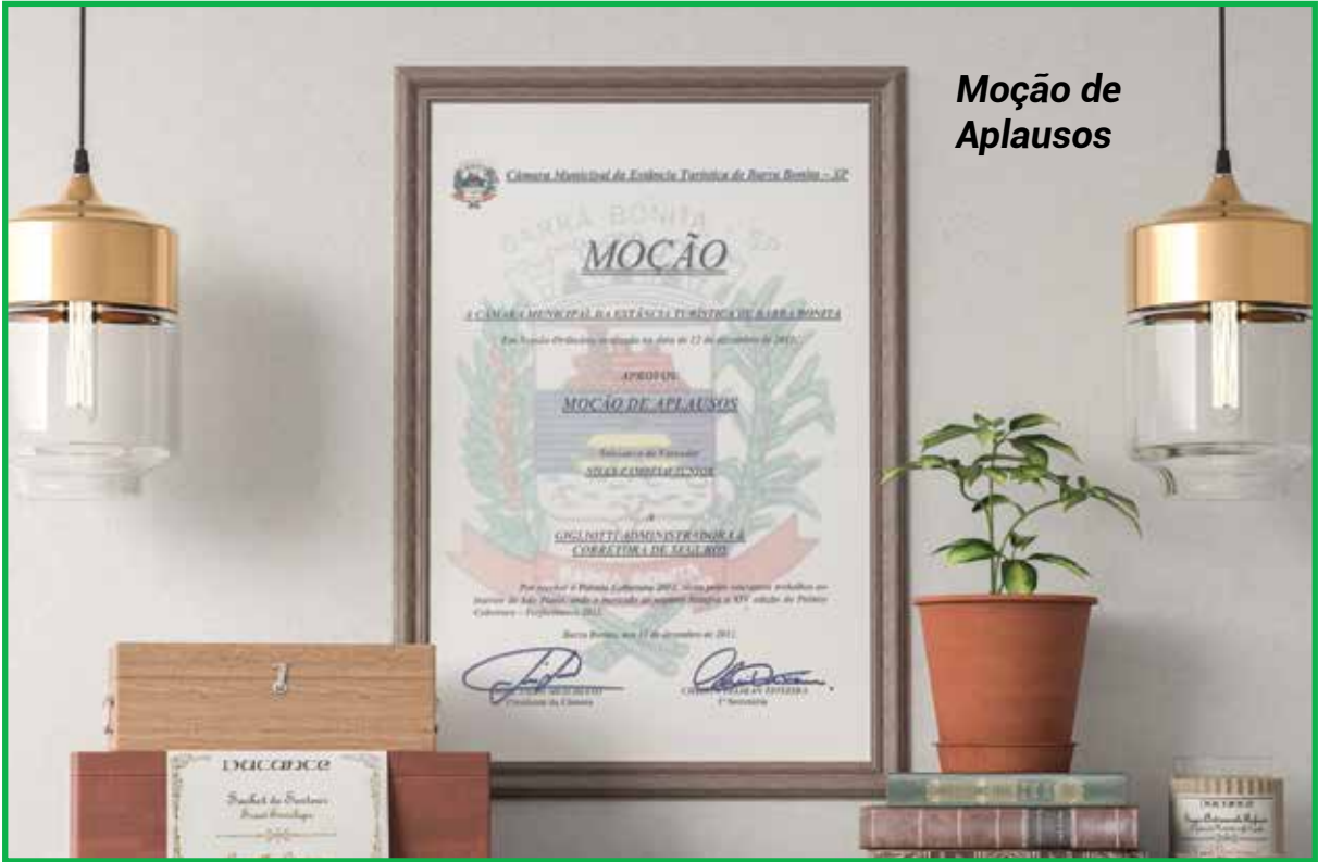
Moção de Aplausos